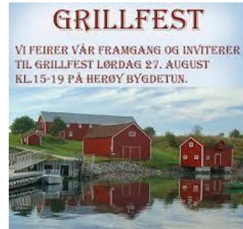
Feire alle suksesser