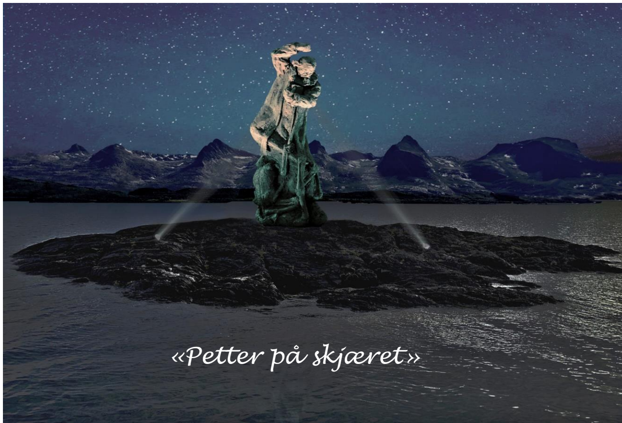
«Petter på skjæret»