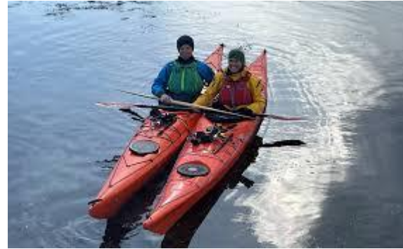
Kos: «Det gode liv»