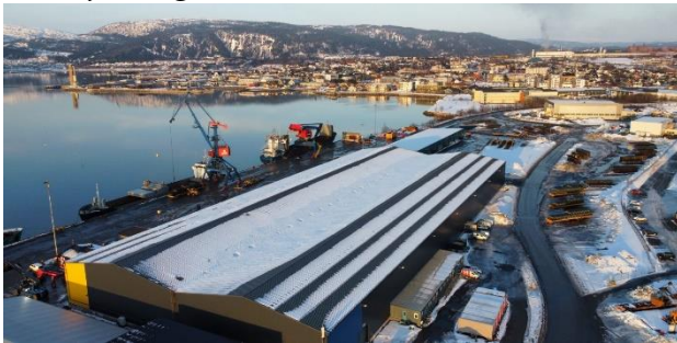
Freyr, Customer Qualification Plant

Sekretariatsleder har hatt prosjektlederrollen i Havnesamarbeidsprosjektet i 2023. Her har det vært jobbet mot Kystverket, Mo i Rana Havn. Rana Industriterminal AS, MIP AS og Rana Kommune. Kystverket prosjekt Innseiling Mo i Rana består av merking, mudring, deponi og nytt dypvannskai. I tillegg har det vært jobbet med utredning av et felles driftsselskap i Mo i Rana havn. Det forventes at partene vil ta beslutning tidlig i 2024 på driftsselskapet. Når det gjelder dypvannskaia pågår nå anbudsrunder, og det er planlagt byggestart tidlig i 2024. Rana Kommune vil i startfasen være 100% eier da MIP så langt ikke har gått inn i prosjektet, men har som intensjon å gå inn med underkant av 50%.