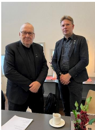
Leder og n. Leder 2022-2023