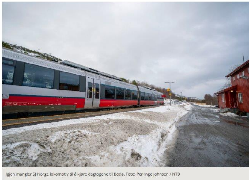
Igjen mangler SJ Norge lokomotiv til å kjøre dagtogene til Bodø.

Buss for tog over Saltfjellet på Nordlandsbanen vil vedvare ut januar: