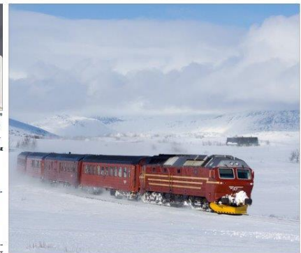
BUSS FOR TOG: Buss for togene ut januar vil det igjen være mulig å kjøre lokomotivene over Saltfjellet for SJ Norge på Nordlandsbanen.

Hun forteller at Norske Tog, som er det statlige selskapet som eier togene, i tillegg har kjøpt to brukte lokomotiver fra Sverige som de har kjøpt inn til bruk på Nordlandsbanen i slutten av oktober. Det er det fire lokomotivene som er kjøpt inn til bruk på Nordlandsbanen, sier Ness.