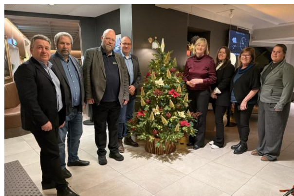
Delegasjon Fylkestinget desember 2025

Polarsirkelrådet har hatt delegasjoner til fylkestingets møter, og møter med Fylkesråd, har også hatt møter med statsråder/statssekretærer og stortingsrepresentanter, og har deltatt i Kraft forum Nord, Jernbaneforum Nord og MidtSkandia. Rådet deltar også i flere prosjekter og samarbeidsarenaer som understøtter regional utvikling.