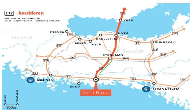
Møte MidtSkandia november 2025