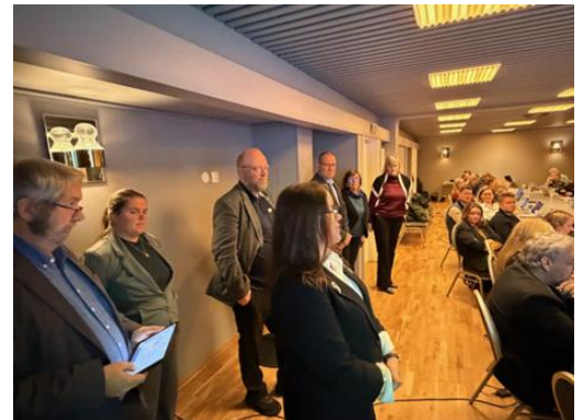
Møte Fylkestingsgruppen, Tannklinikkstruktur

Gjennom orienteringssakene i møtene har rådet også fått løpende status fra sekretariat og medlemskommunene om blant annet økonomi, demografi, skole- og tjenestestruktur, industriutvikling, kraftbehov, samferdselsutfordringer, boligbygging, havbruk, flyplass, dypvannskai, reiseliv og kommunale utviklingsprosjekter.