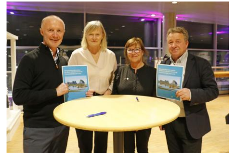
Samarbeidsavtale med NFK