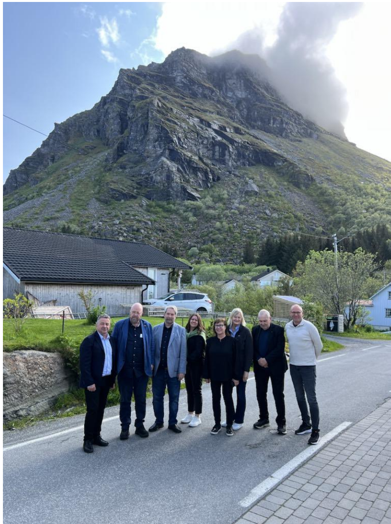
Møte Lovund juni 2025, Rødøy Kommune nytt medlem